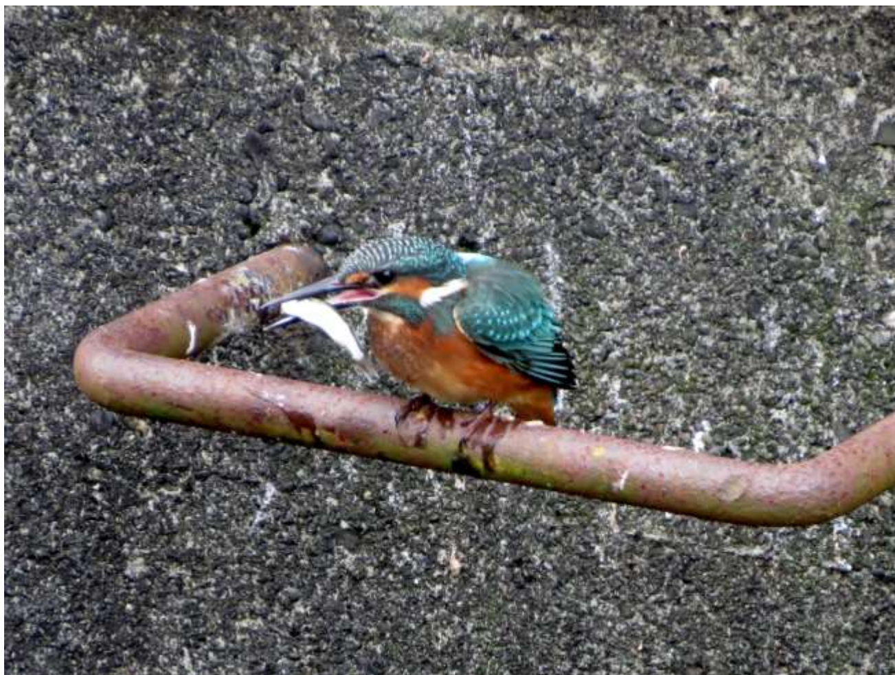
養源寺橋と妙見堂橋の間で (2022年10月)