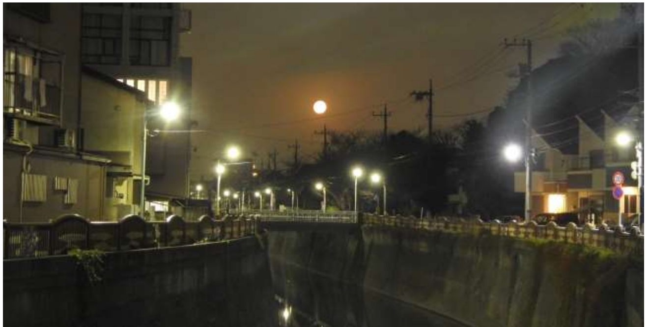
浄国橋から養源寺橋方面の十五夜の夜景（2022年3月）