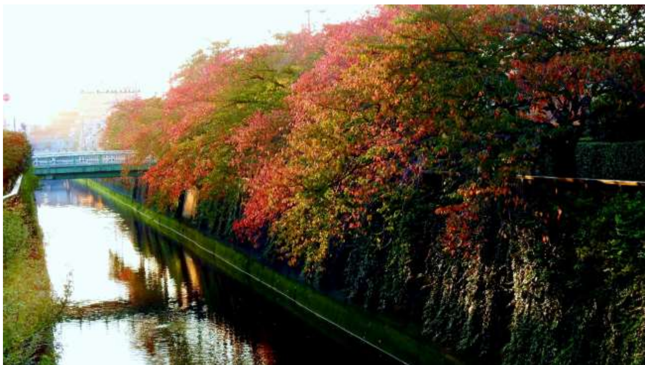
日蓮橋と上堰橋の間の桜並木の紅葉 (2022年11月)