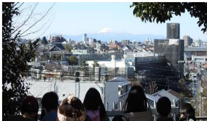
東工大校内の高台からの富士山