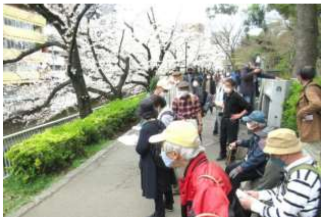
「江戸川公園にて(一時休憩)」

芭蕉庵を出て、「椿山荘」庭園前川沿いの桜をしばし眺めながら、江戸川公園に向かいました。