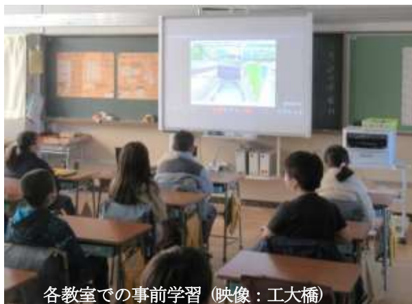
各教室での事前学習(映像：工大橋)

注意事項を確認し、10時過ぎ小学校裏門から第1班がスタートしました。出穂山地蔵や街道碑を見て東工大裏門へ入り、しばらく進むと東工大構内の樹木の間からは富士山の絶景が眺められ(写真)、ここが高台(武蔵野台地の高台部分)であることを説明しました。