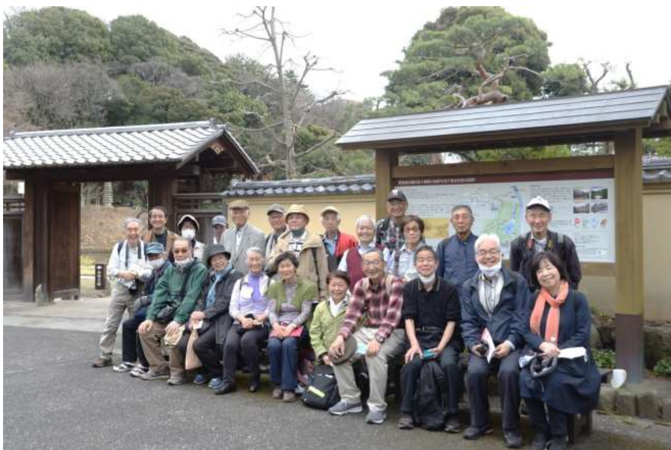
「昼食後記念撮影(肥後細川庭園 正門広場にて 参加者23 名)」

2 時の解散までであったという間に時間が過ぎ、有意義なウォーキングの1 日を無事終了しました。