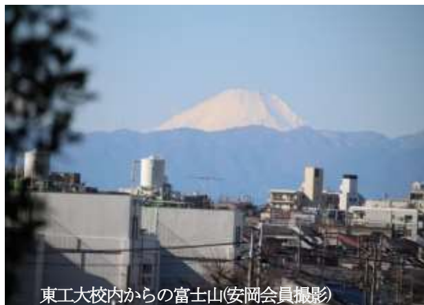
東工大校内からの富士山

石川神社脇の階段を下りしばらく歩き境橋へ、ここで三面コンクリート造りの呑川について説明。上流に辿るとオナガガモ、コガモやカルガモなどが現れて子供達が歓喜。更に上流の工大橋の広場へと進み、ここで、説明看板をもとに呑川の源流や新宿落合水再生センターからの送水ルートなどの説明をしました。次に、実際に「黒膜で被われた流水の出口」を確認したあと、地下道を潜り、更に上流側の呑川緑道(現在は暗渠部分となっている)を見学・確認し、再び地下道をUターン。次の川の流れを測る島畑橋に向かいました。流速測定手順は各役割が事前に決められていました。島畑橋上から川面中央部に、流速測定用の木片チップをグループごと声かけし落とす⇒チップを追いかける⇒石川公園手前の一本橋上で計測係りが計測する。因みに、第4班の計測時間は、4分6秒(246秒)でした。「参考：橋と橋の間は約200mあり、流速は 200\text{m}/246\text{秒} \times 60 = 48.8\text{m}/\text{分} 」