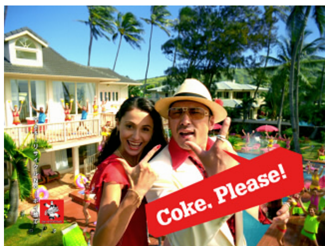
「Coke, Please!」キャンペーン 「コカ・コーラ」第一弾 TV-CM 『クレイジーケンバンド in ハワイ』篇より