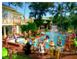
コカ・コーラ～ コカ・コーラ～ みんなでそろって コカ・コーラ～ (チン) スカッとさわやか コカ・コーラ～