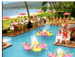
スカッとさわやか