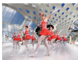
スカッとさわやか