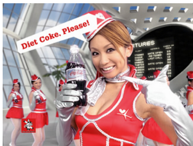
「Coke, Please!」キャンペーン 「ダイエット コカ・コーラ」第一弾 TV-CM 『エアポート』篇より