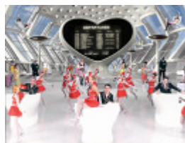
みんなでそろって