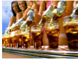
コカ・コーラ SE “シュワー”