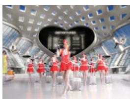
Diet Coke を