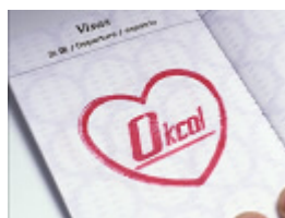
SE “バスン / ポワーン”