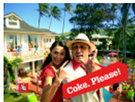
剣さん 「Coke Please!」 SE “チュッ” 「イイネ!」 SE (スピーチバブル) “キラリンッ”