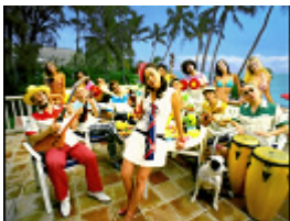
ボボボボン コカ・コーラを