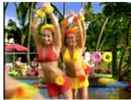
みんなでそろって