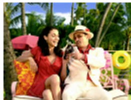
コカ・コーラ～ (チン)